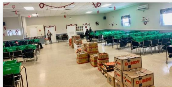
C'est un record de 666 paniers (chiffre chanceux, non? Hehe) qui ont été distribués en février. Merci à nos bénévoles et à tous les participants.